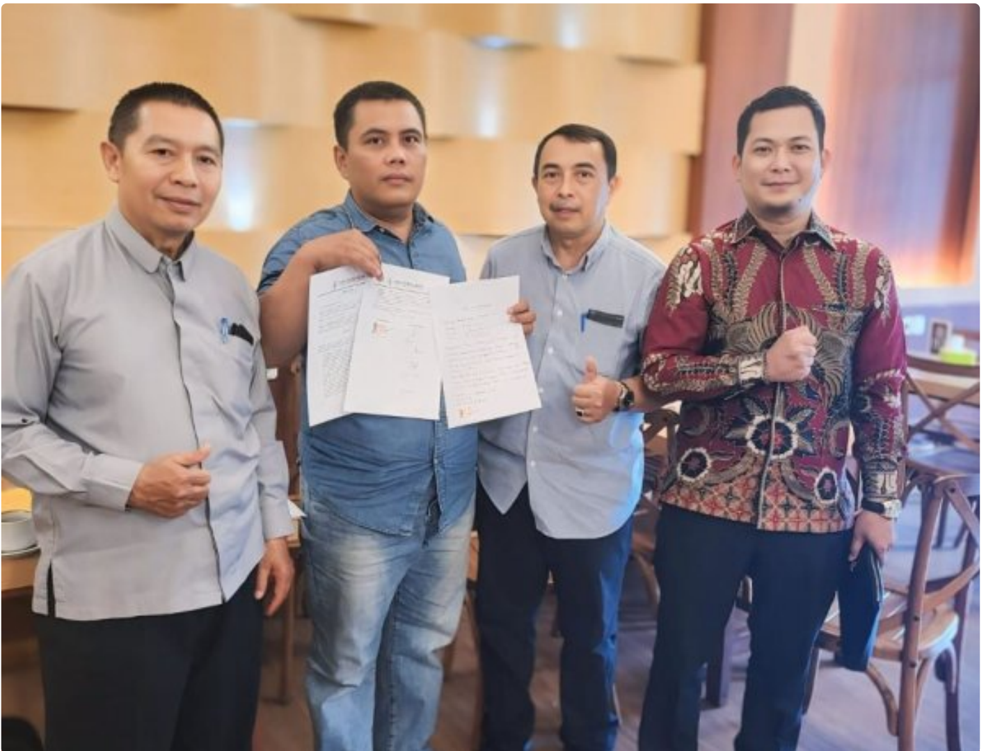
Kuasa Hukum Ningto Wahyu Dens & Partners Lawfirm di perkara Dugaan Pemalsuan Data dan Kredit Fiktif di Bank BRI Unit Kalideres.

JAKARTA, JNI - Seorang bekas nasabah Bank BRI, yang dikenal dengan inisial NW, melaporkan dugaan pemalsuan data dan kredit fiktif yang melibatkan oknum